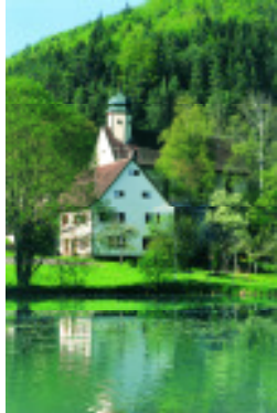
St. Gallus-Kirche in Mühlheim

Das Erholungsgebiet „Donau-Heuberg“ im Naturpark „Obere Donau“ liegt zwischen dem Raum Stuttgart und Bodensee.