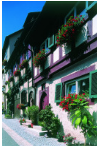
Häuserfront in Mühlheim

Am Anreisetag in einer Unterkunft ihrer Wahl (Gasthof, Ferienwohnung, Privatzimmer) erhalten Sie den Kriminalroman „Vom gelben Felsen“ zusammen mit einer Wanderkarte und Stationsvorschlägen.