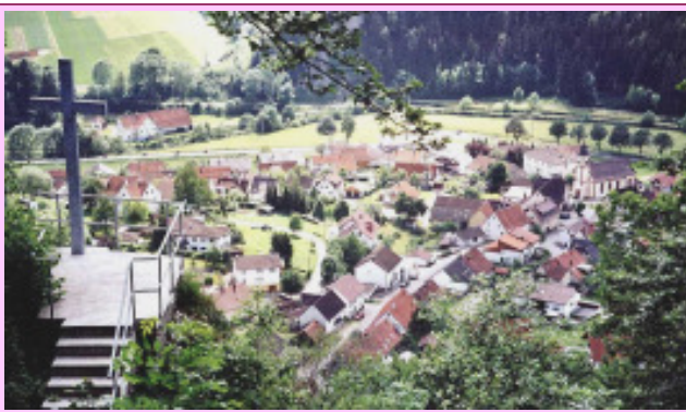
Blick vom Kreuzfelsen auf Bärental

Genießen Sie die Stille und Besinnlichkeit in einer herrlich unberührten und wildromantischen Gegend.