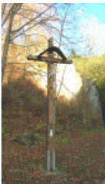
Christliche Pforte „Am Täle“ in Bärenthal

Das Erholungsgebiet „Donau-Heuberg“ im Naturpark „Obere Donau“ liegt zwischen dem Raum Stuttgart und dem Bodensee.