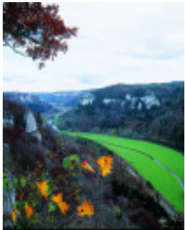
Blick vom Eichfelsen

Das Erholungsgebiet „Donau-Heuberg“ im Naturpark „Obere Donau“ liegt zwischen dem Raum Stuttgart und Bodensee.