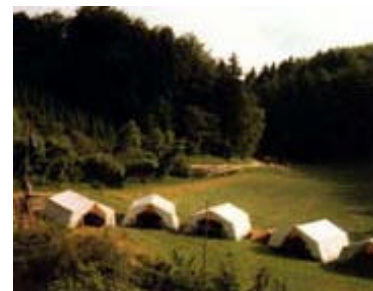
Schönbühl mit Zeltlager

Tel.: 07466/1263 Träger des Hauses: Förderverein des Evang. Jugendwerks Bezirk Tuttlingen